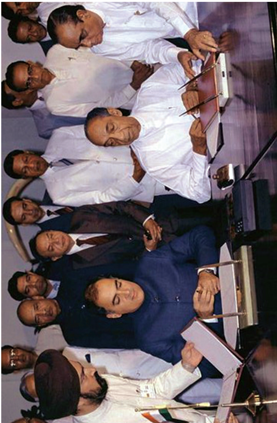
ඉන්දු ලංකා ගිවිසුම අත්සන් කිරීම